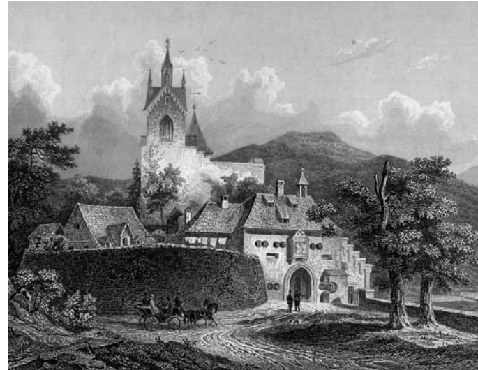
Stahlstich von Schloss Eberstein um 1830. Der neugotische Turmaufsatz wurde 1870 wieder abgetragen.

Das Wappen der Ebersteiner zeigte ursprünglich nur die fünflättrige Rose . Sie ist seit 1207 nachweisbar. Der Eber wurde erst viel später (um 1600) als Verkörperung des Familiennamens ins Wappen aufgenommen.