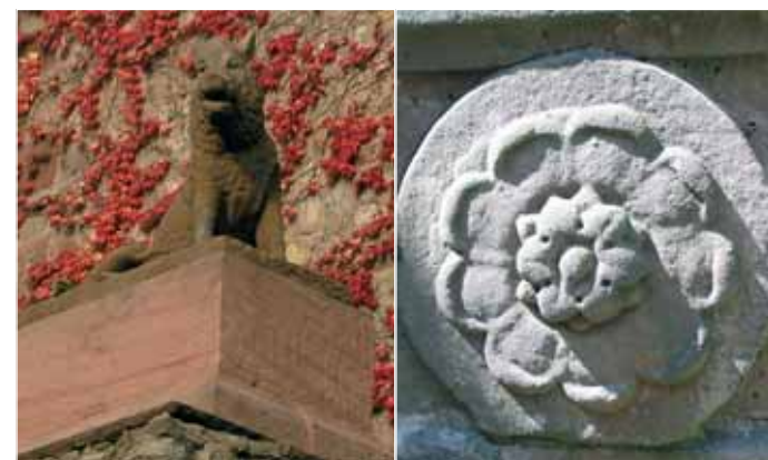
Der Eber und die Ebersteiner Rose am Brunnen im Innenhof

Gegenüber dem Burgtor auf einem Stützpfiler der Zwingermauer fällt der lebensgroße Eber aus Sandstein ins Auge – das Wappentier der Ebersteiner. Sein Vorbild ist eine antike Statue in den Uffizien von Florenz. Als Schöpfer gilt der bedeutende, aus Flandern stammende Künstler Peter Anton von Verschaffelt, von 1752 bis 1793 erster Hofbildhauer am Kurpfälzischen Hof in Mannheim. Seine Entwurfszeichnung zu der Plastik befindet sich im Kurpfälzischen Museum in Heidelberg. Der Eber könnte ursprünglich für den Schlossgarten in Schwetzingen oder für einen Privatmann bestimmt gewesen sein. Erworben wurde er wahrscheinlich von Markgraf Friedrich im Zuge der ersten Sanierung um 1800. Nach einer alten Beschreibung stand er bereits 1824 an seinem jetzigen Platz.