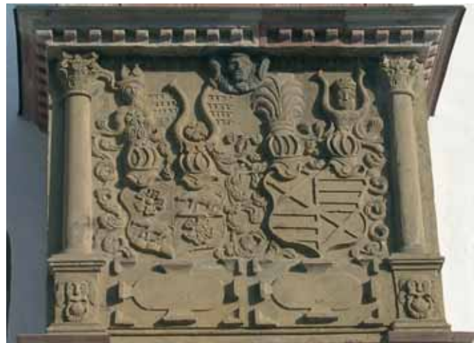
Das Wappen der Ebersteiner am Torhaus

1085 tauchen die aus der Ortenau stammenden Herren von Eberstein zum ersten Mal in einer Urkunde auf. Ihre Namen gebende Stammburg bei Ebersteinburg/Baden-Baden (heute Ruine Alt-Eberstein) ist um 1050 entstanden. Zwischen 1102 und 1149 erhalten sie vom Bistum Speyer das Gut Rotenfels mit ausgedehntem Landbesitz im Murgtal zu Lehen. Kurz vor 1200 beginnen die Ebersteiner sich Grafen zu nennen. Sie haben Besitz im Elsass, in der Ortenau, in den Tälern von Murg, Alb und Pfalz sowie im Kraichgau und in der Pfalz. Sie treten als Klostergründer (Herrenalb 1148, Frauenalb 1190, Rosenthal bei Eisenberg/Pfalz 1241) und als Gründer von Städten hervor (Kuppenheim, Gernsbach, Gochsheim im Kraichgau). An Bedeutung überflügeln sie um 1200 sogar die Markgrafen von Baden. 1283 jedoch kommt Burg Alt-Eberstein mit einem großen Teil der Ebersteiner Besitztümer an den Markgrafen von Baden, der mit Kunigunde von Eberstein verheiratet ist. Schon um 1300 ist durch dynastische Zufälle und unkluge Erbteilungen der Besitz der Ebersteiner erheblich geschrumpft. Die benachbarten Markgrafen von Baden und Grafen von Württemberg werden zu bedrohlichen Konkurrenten. Im 14. Jahrhundert setzt sich der Niedergang rapide fort. 1387 muss der legendäre Graf Wolf von Eberstein wegen enormer Schulden die Hälfte der Grafschaft Eberstein und der Burg Neu-Eberstein an den Markgrafen von Baden verkaufen.