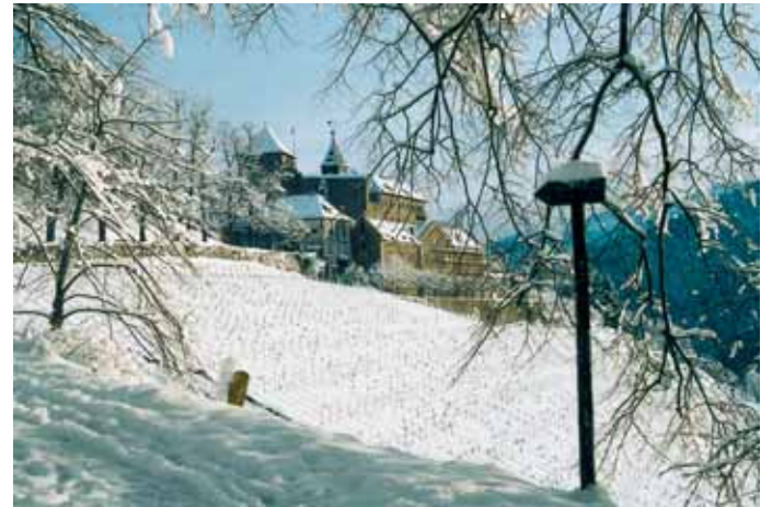
Winterstimmung um Schloss Eberstein

Auf einer Felsnase, 130 m über der Murg, in Sichtweite von Gernsbach, liegt inmitten üppiger Vegetation Schloss Eberstein. Besonders seine Südfront mit dem nach Obertsrot hin steil abfallenden Weinberg prägt das Landschaftsbild. Geschichte, Baukunst und Natur sind hier eine glückliche Verbindung eingegangen – nicht zu vergessen die Gastronomie. Schloss Eberstein war immer ein Wahrzeichen des Murgtals. Nach einem langen Dornröschenschlaf ist es nun auch wieder eines der beliebtesten Ausflugsziele der Region und darüber hinaus.